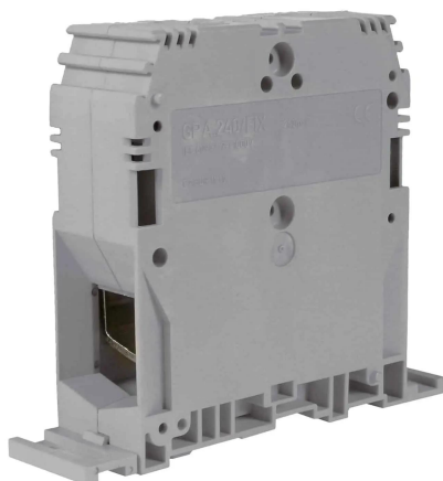
Morsetto di potenza a vite, 240 mm 2 , beige