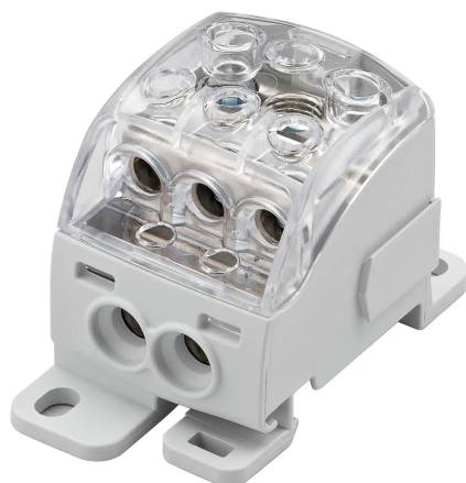
morsettiera di distribuzione unipolare 160A, grigio