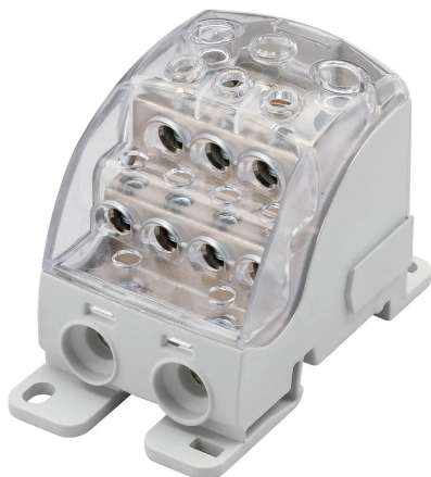
morsettiera di distribuzione unipolare 250A, grigio