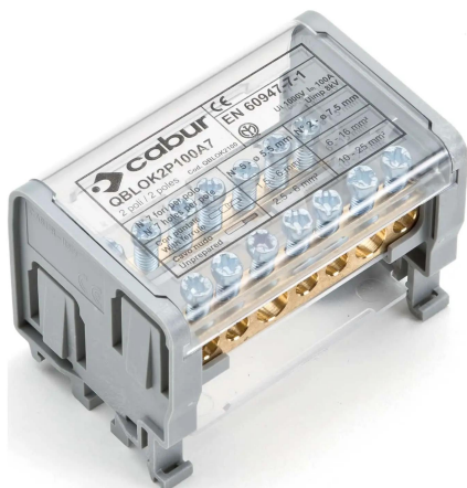
morsettiera di distribuzione bipolare, 100A, grigio